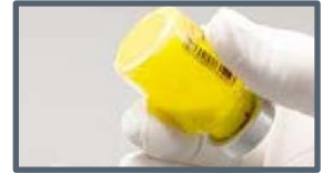
Suspension: pas de grumeaux