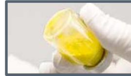
Pas de suspension: grumeaux visibles